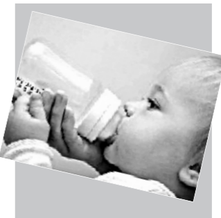
欧洲一项在12所儿科重症监护病房内实施的多

中心、随机、双盲及安慰剂对照研究表明,对于接受机械通气的下呼吸道感染患儿,地塞米松[0.6毫克/(千克体重·天)]对轻度氧合异常[氧合指数>26.7千帕(200毫米汞柱)]和重度氧合异常(氧合指数≤26.7千帕)患儿均未产生积极影响,也未延长患儿机械通气时间。论文在线发表于《重症医学》杂志。(李明亮)